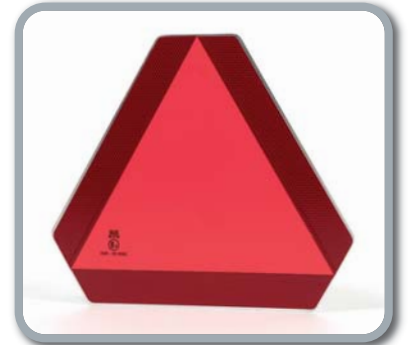
Heckwarntafel (ECE 69)