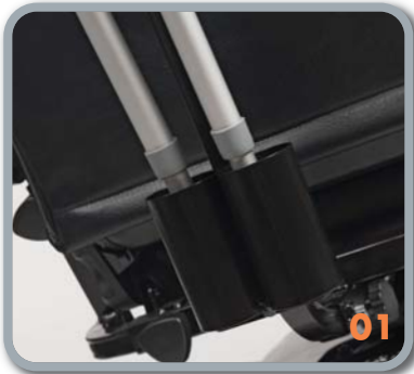
Gehstockhalter (SW31 - SH31)