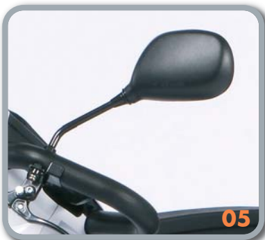
Rückspiegel (x1) (SH74 - SW74)