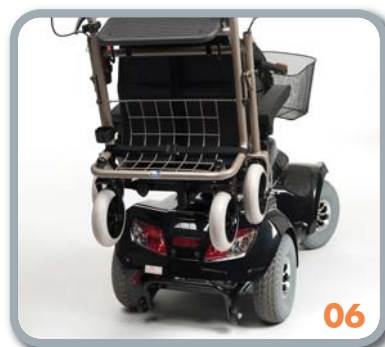
Rollatorhalter (SH06 - SW06)