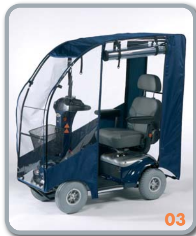
Regenverdeck (SH04 - SW04) (nicht möglich bei 3-Rad-Modellen)