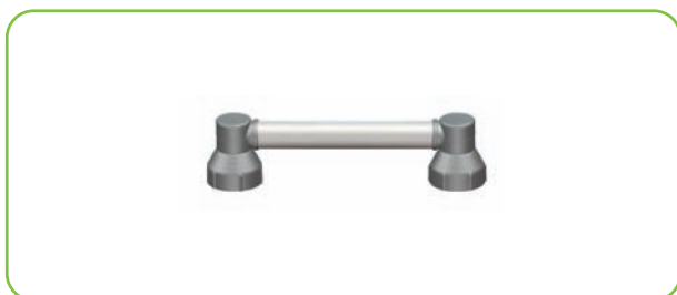
Haltegriff 30 cm , Art.Nr. 61.000020 Gesamtlänge 31,6 cm

Das vario plus Grundsortiment in fugengrau/weiß und weiß lackiert