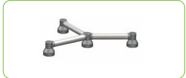
Y-Gelenkgriff 55/30 , Art.Nr. 63.202020 Gesamtlänge 56,8 cm