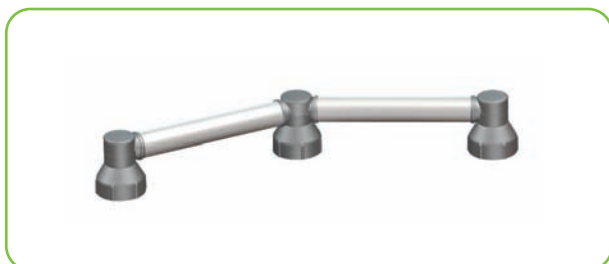
Gelenkgriff 55 cm , Art.Nr. 62.002020 Gesamtlänge 56,8 cm