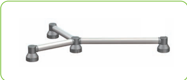
Y-Gelenkgriff 55/50 , Art.Nr. 63.202040 Gesamtlänge 56,8 cm