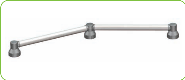
Gelenkgriff 95 cm , Art.Nr. 62.004040 Gesamtlänge 96,8 cm