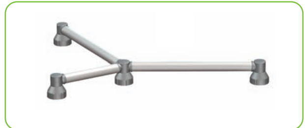
Y-Gelenkgriff 95/30 , Art.Nr. 63.204040 Gesamtlänge 76,8 cm