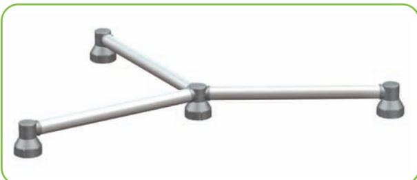
Y-Gelenkgriff 95/50 , Art.Nr. 63.404040 Gesamtlänge 96,8 cm

Nicht nur die extrem gute und sichere Klebewirkung des vario plus Griffsystems ist für die absolute Sicherheit der Belastungsfähigkeit verantwortlich. Höchste Ansprüche wurden auch an die gewählten Materialien gestellt! Die Griffrohre sind aus strang-gespresstem, hochwertigem Aluminium , die Träger aus glasfaserverstärktem Polyamid .