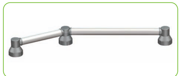
Gelenkgriff 75 cm , Art.Nr. 62.002040 Gesamtlänge 76,8 cm