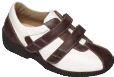
Damen-Diabetes-Schutzschuh mit Klettverschluss

Die Verordnung von konfektionierten Schutzschuhen ist dann notwendig, wenn eine Fußwunde vorgelegen hat, aber der Fuß noch nicht so deformiert ist, dass eine Maßschuh-Versorgung erforderlich ist.