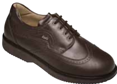
Herren-Diabetes-Schutzschuh als Schnürschuh

Sie können mit diabetesadaptierter Weichbettung und mit einer Sohlenversteifung ausgestattet werden. Bettungseinlagen haben, wie der Name schon sagt, die Funktion, den Fuß zu betten, ihn durch Druckumverteilung zu entlasten und durch stoßdämpfende Eigenschaften zu schützen.