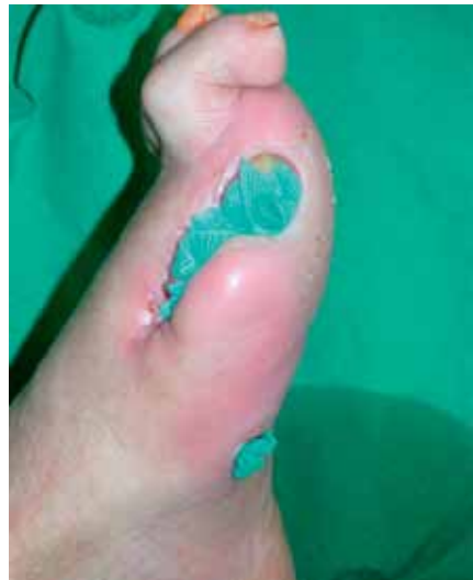
Lokale antimikrobielle Therapie bei Diabetes-Fußsyndrom

Bei nicht infizierten Wunden wird auf Antibiotica verzichtet. Haben sich offene Stellen am Fuß entzündet, müssen Erreger und Entzündung bekämpft werden. Bei Patienten mit milden Infektionen sollte eine lokale und systematische Behandlung mit Antibiotica unter Berücksichtigung individueller Risiken erwogen werden. Bei moderaten und schweren Infektionen soll antibiotisch behandelt werden, wobei bei Verdacht auf eine schwere Infektion der Beginn intravenös erfolgt. Häufig lassen sich verschiedene Keime in einer Wunde nachweisen, was eine Kombination verschiedener Antibiotica erforderlich macht. Topische Antibiotica sind obsolet, weil dadurch Resistenzen entwickelt werden können.