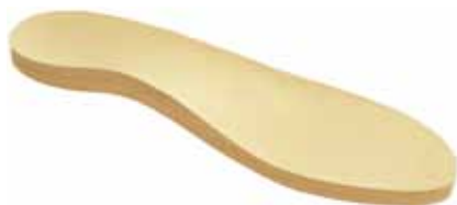
Standardweichbettung für Diabetes-Patienten

Sie werden nach biomechanischen Gesichtspunkten konstruiert, um Fehlstellungen und damit auch Fehlbelastungen zu vermeiden.