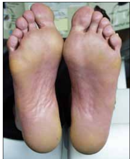
PNP-geschädigter Fuß, einfach ohne Deformierung, Zustand nach Ulcus.

Diese Diabetes-Füße sind warm, rot und trocken.