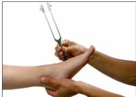
Stimmgabeltest: Überprüfung des Vibrationsempfindens peripherer Nerven