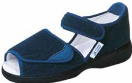
Verbandschuh als Sandale