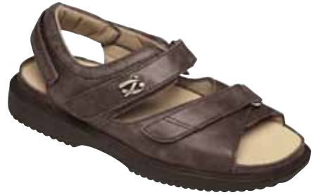
Damen-Diabetes-Schutzschuh als Sandale

DNOAP) sind spezielle Hilfsmittel nötig, um eine Wundheilung zu ermöglichen. Dazu zählen etwa Spezialschuhe, Orthesen und Vollkontaktgips, wenn erforderlich unterstützt durch Gehstützen, Rollstuhl oder strikte Bettruhe. Zur Druckentlastung gehört auch die regelmäßige Entfernung von Hornhaut. Die Belastung kann erst dann wieder aufgenommen werden, wenn durch Untersuchungen eine Stabilisierung des Knochens nachweisbar ist. Eine Versorgung mit Einlagen und Schuhen ist erst nach Abheilung zwingend erforderlich.