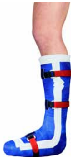
Total Contact Cast

Durch eine spezielle Modellierung der Fußsohle wird erreicht, dass das Gewicht des Patienten von den druckexponierten Stellen des Fußes auf andere Bereiche des Fußes verteilt wird. Zudem wirkt der feste Unterschenkelverband wie ein Schaft, der Teile des Gewichtes