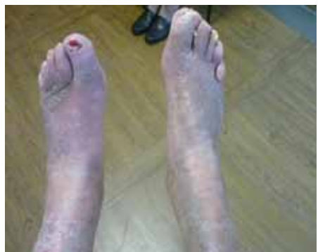
Fuß mit pAVK und CVI (chronisch-venöse Insuffizienz)