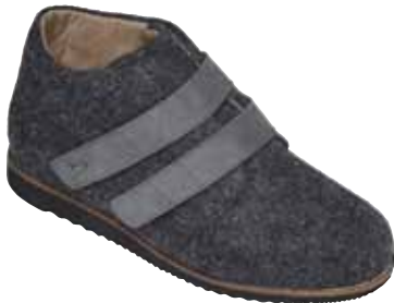
Herren-Diabetes-Schutzschuh als Hausschuh

Die mit über 80 Prozent häufigste Ursache für die Entstehung von Verletzungen der Füße ist ungeeignetes Schuhwerk. Welche Versorgungsart der Arzt in Absprache mit dem Orthopädie-Schuhmacher