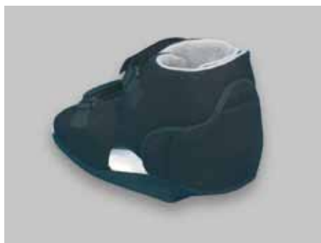
Rückfußentlastungsschuh mit Fersenkappe zum Abkletten