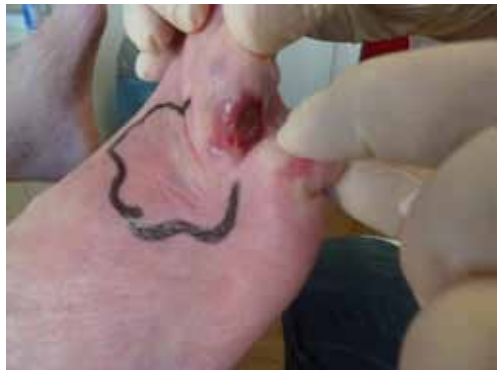
Fuß mit Wunde und Infektion

Diabetiker, die sowohl eine Polyneuropathie als auch eine periphere arterielle Verschlusskrankheit entwickelt haben, bemerken eine Entzündung an den Zehen oder am Fuß nicht ausreichend schnell. Bakterien können sich von den Entzündungsherden ausgehend weiter im Gewebe des Fußes ausbreiten. Die schlechte Durchblutung der Füße bewirkt, dass die körpereigene Abwehr gegen diese bakterielle Infektion beeinträchtigt wird. Im Extremfall erfasst die Entzündung den gesamten Fuß und lässt sich letztlich nicht mehr mit Medikamenten beherrschen.