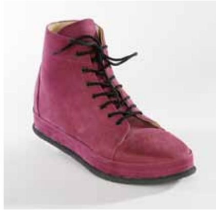
Orthopädischer Maßschuh Damenstiefel mit diabetes-adaptierter Fußbettung

Bei fortgeschrittenen Fußdeformitäten ist eine Versorgung mit orthopädischen Maßschuhen in Verbindung mit einer diabetes-adaptierten Fußbettung erforderlich. Dies ist dann der Fall, wenn der Fuß in seiner Form, Funktion und/oder Belastungsfähigkeit so verändert ist, dass weder fußgerechtes Konfektionsschuhwerk, lose orthopädische Einlagen, Therapieschuhe, orthopädische Schuhzurichtungen noch sonstige orthopädische Versorgung in Verbindung mit Konfektionsschuhen ausreichen, um eine dem Krankheitsbild angemessene Gehfunktion aufrecht zu erhalten oder zu ermöglichen.