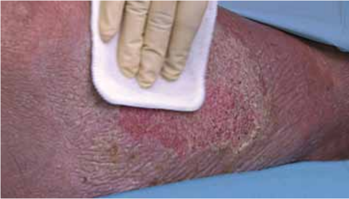
Wundreinigung mit einem Pad aus Hightech- Polyester- Fasern

Im Behandlungskonzept des Diabetes-Fußsyndroms spielt die Lokalthherapie der entstandenen Ulcera eine wichtige Rolle. Abhängig