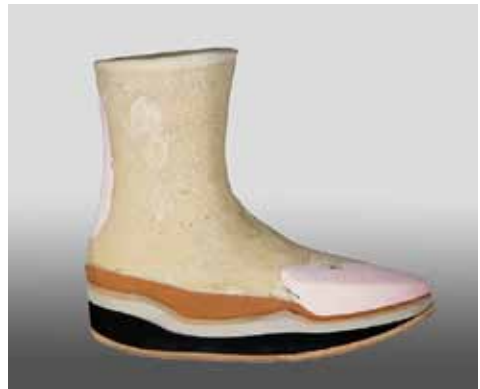
Leisten vom Charcot-Fuß mit diabetes-adaptierter Fußbettung

Dies gilt insbesondere dann, wenn z.B. eine große Kraft auf den Fuß wirkt, beispielsweise bei jüngeren übergewichtigen bzw. großgewachsenen Menschen. Gleichzeitig bewirkt die verstärkte Durchblutung durch dauerhafte Weitstellung kleiner Gefäße eine Entmineralisierung der Knochen. Die Knochenstruktur ist geschwächt, die Belastbarkeit nimmt ab. Für einen gesunden Fuß harmlose leichte Stöße, hartes Auftreten oder Stauchungen zerstören nun mit der Zeit Knochen und Gelenke. Im fortgeschrittenen Stadium sackt das Fußgewölbe zusammen. Der Fuß ist ödematös geschwollen, gerötet und überwärmt. Knochenfragmente und massive Fehlstellungen in den Gelenken drücken auf das Gewebe und führen zu Geschwüren.